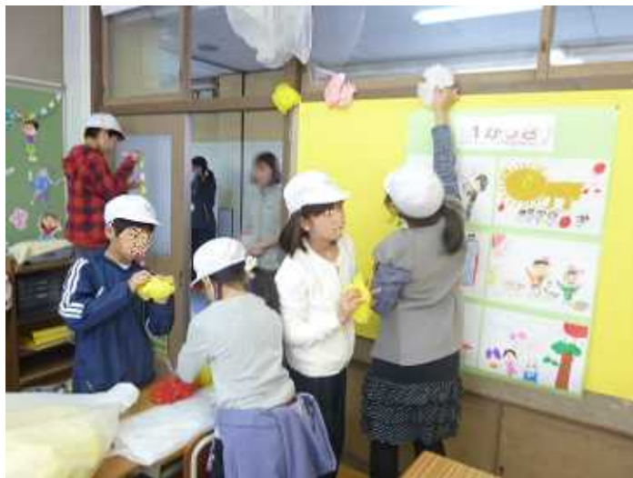
6年生 準備登校（5日）：新6年生が教室掲示や清掃を行い、1年生を迎える準備をしました。