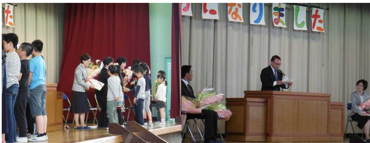
離任式（28日） 昨年度までいらした先生方にお礼の手紙や花束をお渡しすることができました。