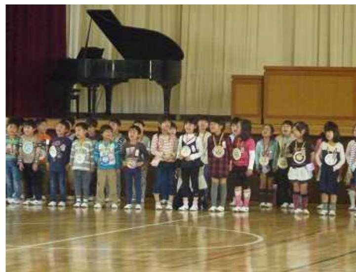
1年生を迎える会（16日）：プレゼントやおんぶじゃんけんなど、楽しい会でした。