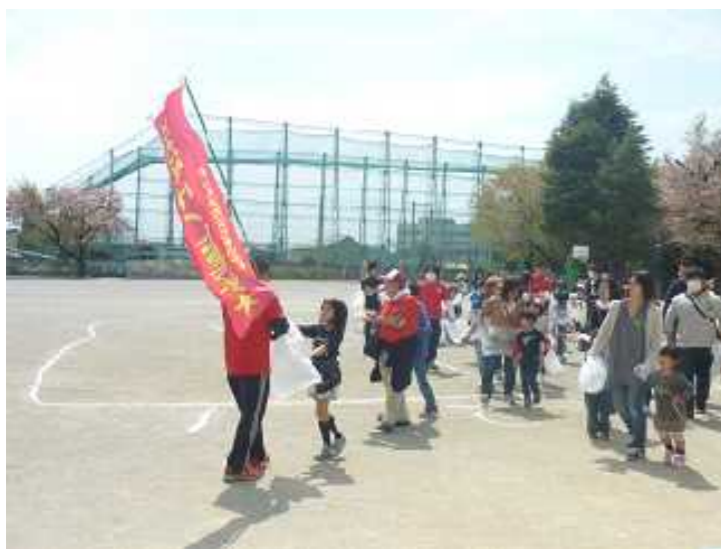
クリーン活動（14日）：学校の周辺をグループに分かれてゴミ拾いを行いました。100名以上もの参加がありました。おやじの会、PTAの皆様ありがとうございました。