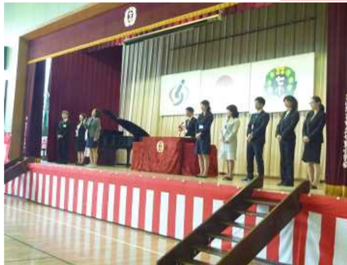
始業式（10日）：新しくいらした先生方の紹介や、担任の先生の発表がありました。また、4月の生活目標「あいさつをしっかりしよう」についてお話しがありました。