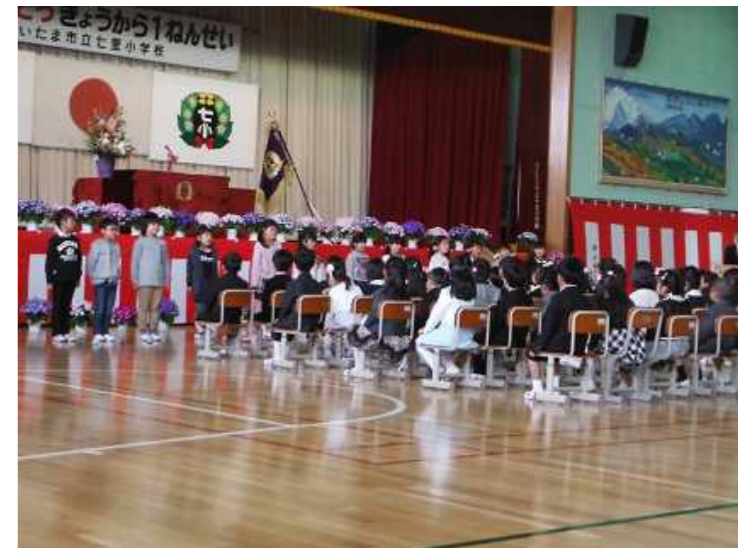
入学式（10日）：2年生が学校代表として、七里小の紹介をしました。